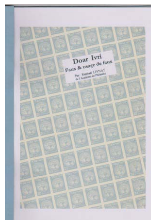
Faux et usage de faux